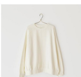
スウェット(ホワイト)