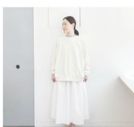
THE HANDWORKSのお洋服(1 items)