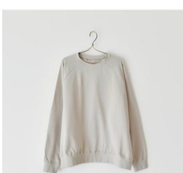
スウェット(ベージュ)