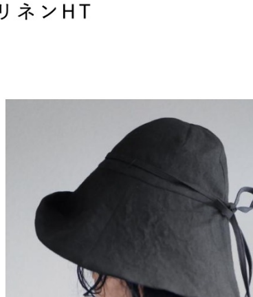
size1 long BK