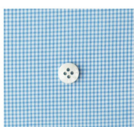
base fabric (4 items)