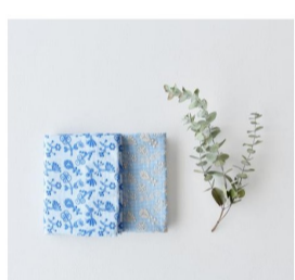
cut cloth (5 items)