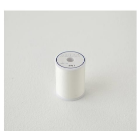
book/thread (13 items)