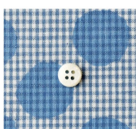
dot diamond (2 items)