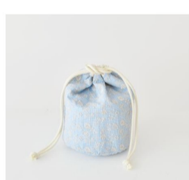
kit (2 items)