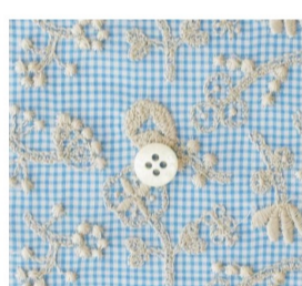
field of flower (2 items)