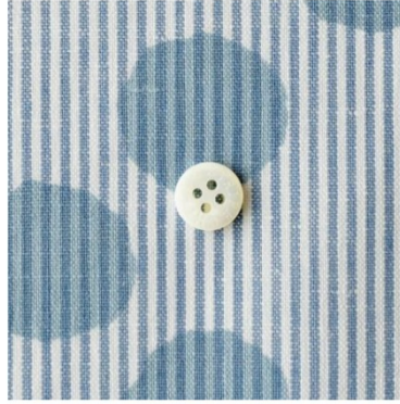
stripe chic blue