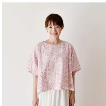
白にワイルドローズ：

『CHECK&STRIPEのおとな服ソーイング・レメディー』(文化出版局) バルーンスリーブのブラウス