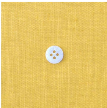
カナリーイエロー