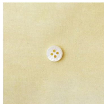
クリームイエロー