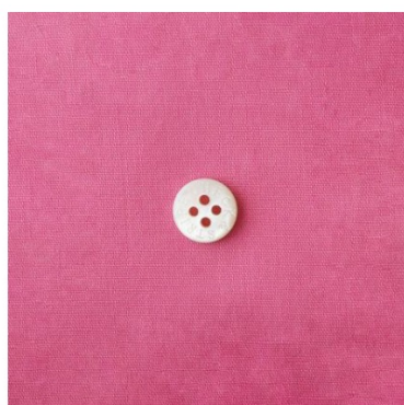
フレッシュピンク