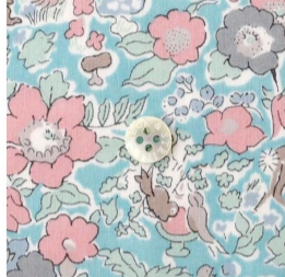
タナローン Woodland Betsy(3色)