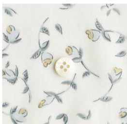
CHECK&STRIPEセレクトラミネート(10 items)