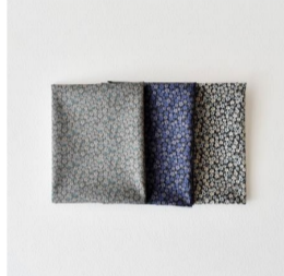
タナローンカットクロスセット(3 items)