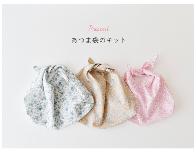
あづま袋のキット

今回の「4月リパティプリント限定柄予約販売」の商品を税抜7,000円以上(税込7,700円)ご注文いただき、宅急便をお選びの方にリパティプリントでつくる「あづま袋のキット」をプレゼントいたします。