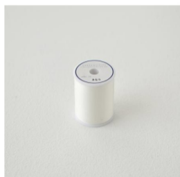
副資材・ミシン系など