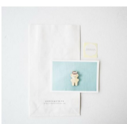
ラッピングセット(2 items)