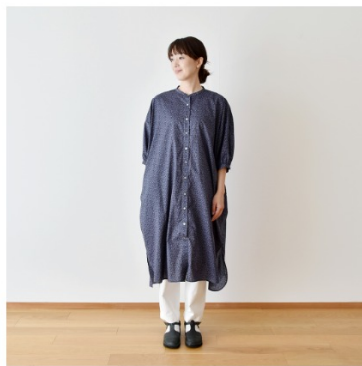
◎J26B(パープル系): 『CHECK&STRIPE My sewing life』(世界文化社) 小さなスタンドカラーのブラウス