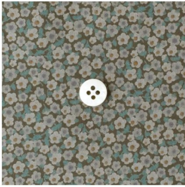
◎J26A(グレイッシュカーキ系)