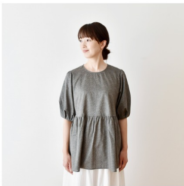
◎J26A(グレイッシュカーキ系): 『CHECK&STRIPE My sewing life』(世界文化社) プロムナードのブラウス