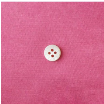
フレッシュピンク