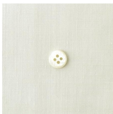
アンティークホワイト