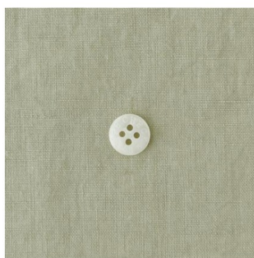
ピスタチオクリーム