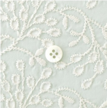
ミンティーにアイボリー