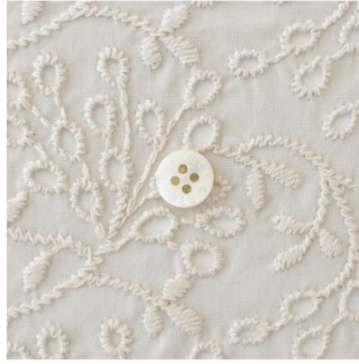
マッシュルームにアイボリー