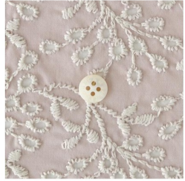
グレイッシュピンクにアイボリー