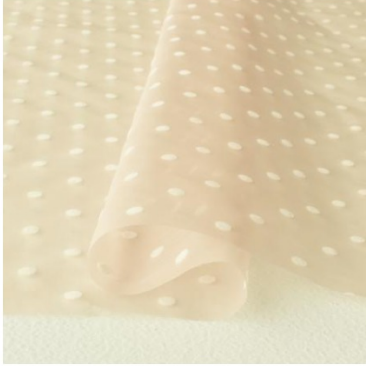
ライトベージュ地にホワイト