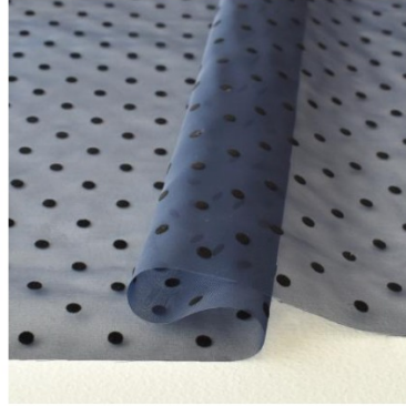
ネイビー地にブラック