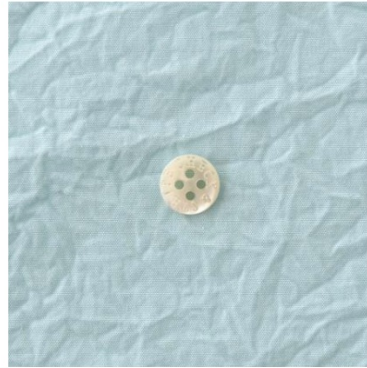
ペパーミントブルー