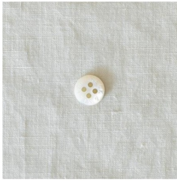
ホワイトグレージュ