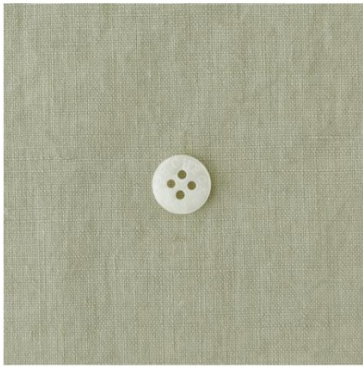
ビスタチオクリーム