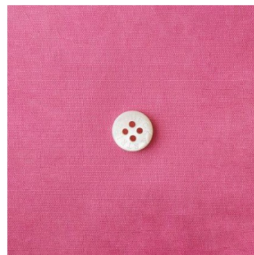
フレッシュピンク