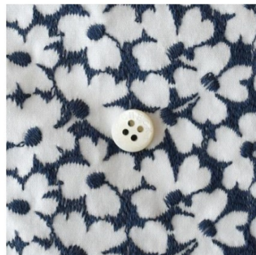
白にアイアンブルー