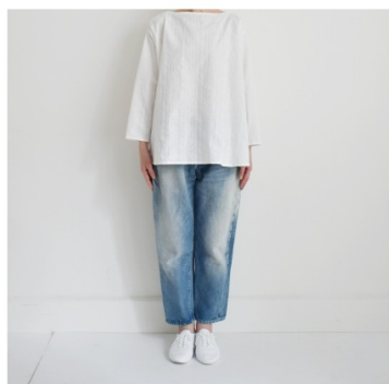
ホワイトにオフホワイト: 『CHECK&STRIPEのおとな服 ソーイング・レメディ』(文化 出版局) ペタルブラウス