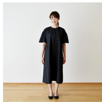
木いちごに黒: 『CHECK&STRIPE COLOUR BOOK 色を楽しむソーイングブ ック』(文化出版局) ギャザース リーブのワンピース