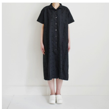
木いちごに黒: 『CHECK&STRIPE SEW HAPPY』(世界文化社) アロハ ワンピース