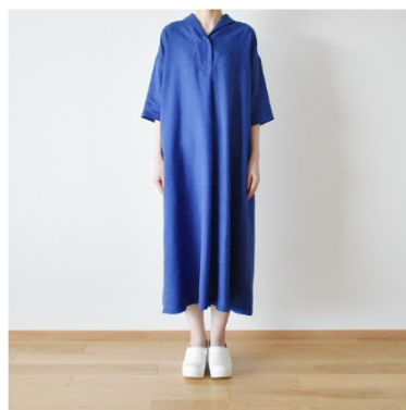
サファイア: 『CHECK&STRIPE Sewing Diary in Paris パリのソーイングダイアリー』(世界文化社) ウィークエンドのワンピース