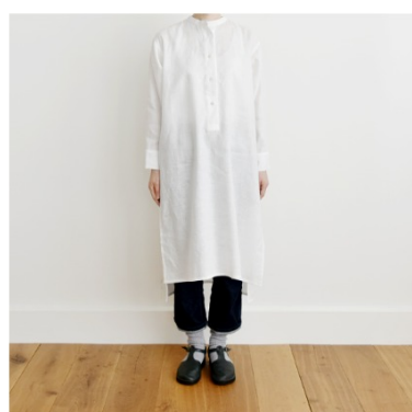
ホワイト:『CHECK&STRIPE SEW HAPPY』(世界文化社) ヘンリーネックのシャツワンピース