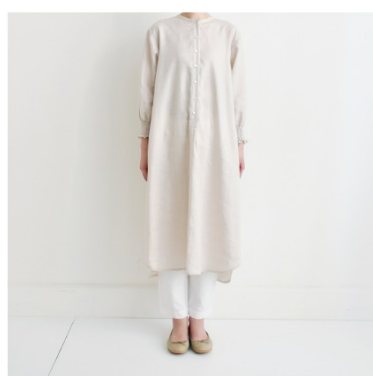
マッシュルーム: パターン 176(スタンドカラーのワンピース)