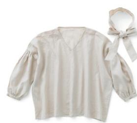
マッシュルーム: CHECK&STRIPEのおとな服 ソーイング・レメディ―(文化出版局) Vネックプルオーバー