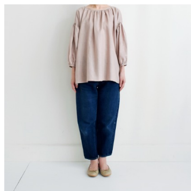
グレイッシュピンク: 『CHECK&STRIPEのおとな服 ソーイング・レメディ―(文化出版局) スタンダードギャザーブラウス