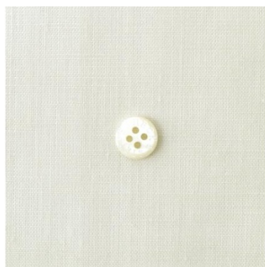
アンティークホワイト