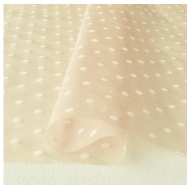
ライトベージュ地にホワイト