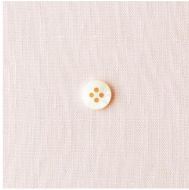
パウダーピンク(新色)