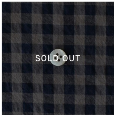
ネイビー×ミルクココア(7mm幅) (新色)