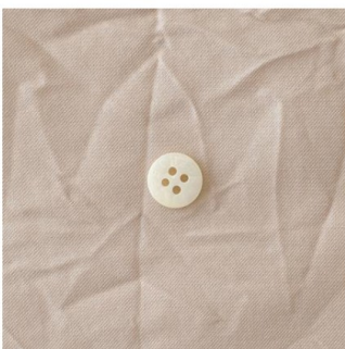
グレイッシュピンク