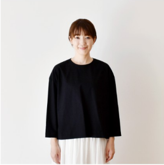
ブラック：『CHECK&STRIPE my favorite 私の好きな服』（主婦と生活社） 後ろボタンのブルオーバー

・特殊な小さい釜で染めております。そのため必ず「色ムラ」や「汚れ」、「強い折りジワ」が見られます。また同じ色名でも、以前にご購入頂きました色とお届けする商品の色にブレが必ず発生いたします。 ・「糸節」や「色糸の飛び込み」などが生地と一緒に染まらずそのまま残る場合があります。