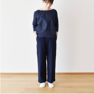
ネイビー：『CHECK&STRIPEのおとな服 ソーイング・レメディ―』（文化出版局） フローラルパンツ

繊維の奥までヒアルロン酸が浸透しているので洗濯を重ねても風合いが長持ちし、しっとりとした質感が続きます。