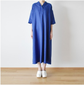
サファイア:『CHECK&STRIPE Sewing Diary in Paris パリのソーイングダイアリー』(世界文化社) ウィークエンドのワンピース