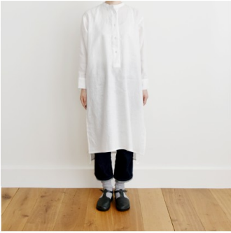
ホワイト:『CHECK&STRIPE SEW HAPPY』(世界文化社) ヘンリーネックのシャツワンピース

揉みこみながら染色を行うことで、ふんわりとしたソフト感がありとても着心地が良く、 また、素材自体に少し光沢感もあるので普段使いの服にも特別な日のお洋服にもおすすめです。 涼しげで軽やかな雰囲気なので、ギャザーやスモッキングなど繊細な表現にもとても良く合います。