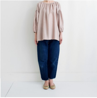
グレイッシュピンク:『CHECK&STRIPEのおとな服ソーイング・レメディ―』(文化出版局) スタンダードギャザーブラウス