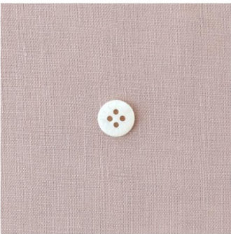
グレイッシュピンク