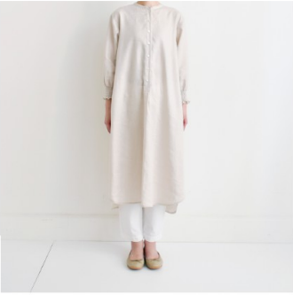
マッシュルーム: パターン176(スタンドカラーのワンピース)