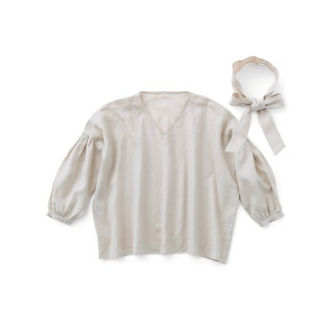
マッシュルーム: CHECK&STRIPEのおとな服ソーイング・レメディ―』(文化出版局) Vネックプルオーバー