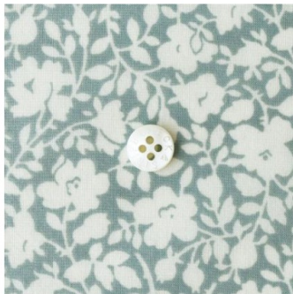
スモークブルーグレー