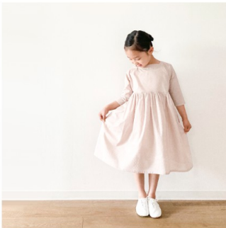
グレイッシュピンク： 『CHECK&STRIPEの子ども服 ソーイング・ナーサリー』（文化 出版局） スクエアネックのギャ ザーワンピース