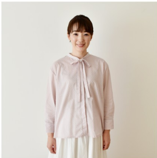
ピンクラベンダー： 『CHECK&STRIPE her closet あのひとの装い』（主婦と生活 社） ポウタイブラウス