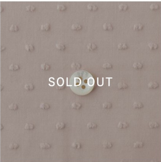
グレイッシュピンク