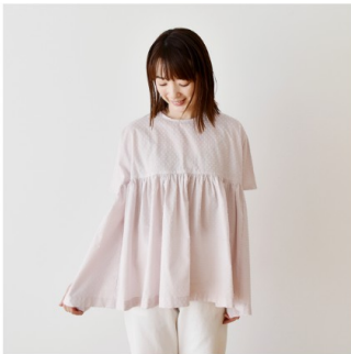
ピンクラベンダー： 『CHECK&STRIPE COLOUR BOOK 色を楽しむソーイングブ ック』（文化出版局） ハイウエ ストのギャザーブラウス