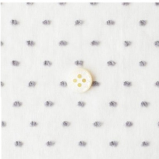
白にラベンデューラ