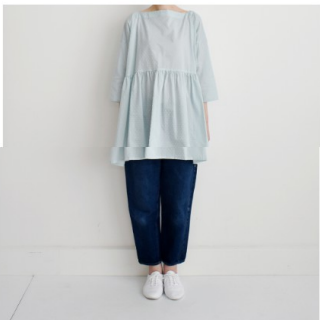
ペパーミント： 『CHECK&STRIPEのおとな服 ソーイング・レメディー』（文化 出版局） スクエアネックのギャ ザーブラウス