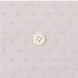
ピンクラベンダー