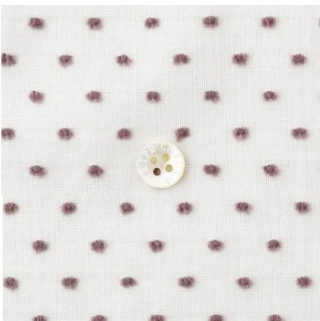
白にあずきミルク