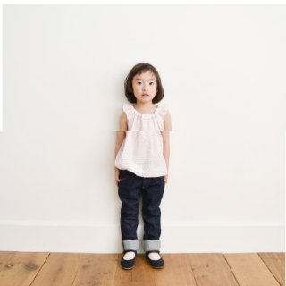
白にピンク：『CHECK&STRIPE SEW HAPPY』（世界文化社） 天使のブラウス 子ども