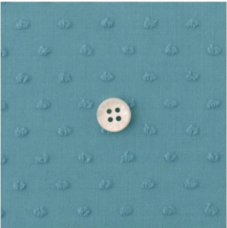
フォーゲットミーノット