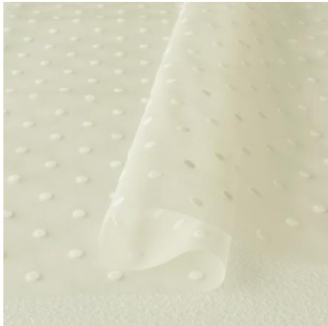
ホワイト地にホワイト(新色)