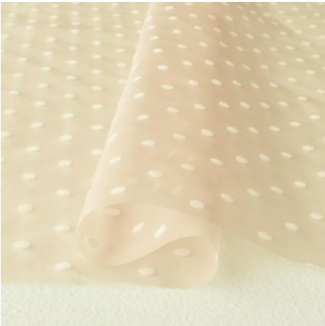
ライトベージュ地にホワイト(新色)