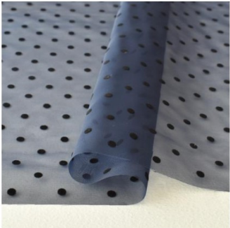
ネイビー地にブラック(新色)