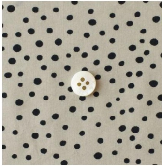
◎J26B(ライトグレイジュにブラック)(新色)