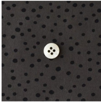
◎J26A(シックブラウンにブラック)(新色)