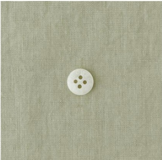
ピスタチオクリーム