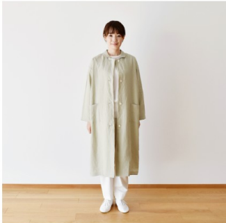
ピスタチオクリーム： 『CHECK&STRIPE Sewing Diary in Paris パリのソーイン グダイアリー』（世界文化社） 旅に出る日のコート