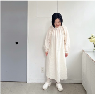
オフホワイト： 『CHECK&STRIPE her closet あのひとの装い』（主婦と生活社） ラグラン袖ワンピース 用 尺:S 4.2m/M 4.3m/L 4.4m

『nounours books』の「わたしの好きな布」、また「 staff sewing 31 」で「ブラック」をご紹介します。 生地選びの参考にぜひこちらもご覧ください。