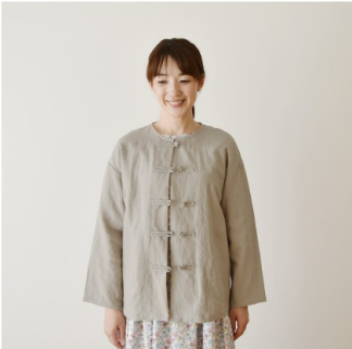
グレージュ：『CHECK&STRIPE COLOUR BOOK 色を楽しむソー イングブック』（文化出版局） チャイナジャケット