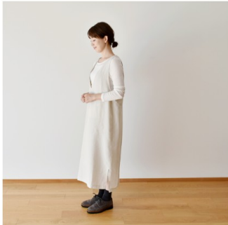
ホワイトグレージュ： 『CHECK&STRIPE my favorite 私の好きな服』（主婦と生活社） Vネックジャンパースカート