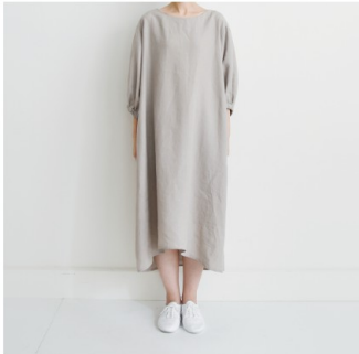
グレージュ：『CHECK&STRIPE のおとな服 ソーイング・レメディ ー』（文化出版局） バルーンスリーブのワンピース