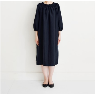
ダークネイビー： 『CHECK&STRIPE SEW HAPPY』（世界文化社） ゴムシャーリングのワンピース