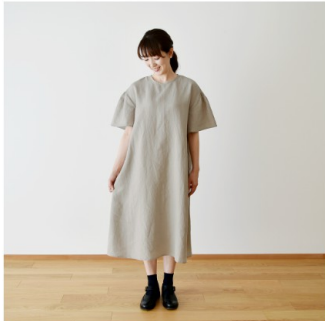
グレージュ：『CHECK&STRIPE COLOUR BOOK 色を楽しむソー イングブック』（文化出版局） ギャザースリーブのワンピース