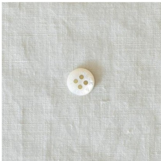
ホワイトグレージュ