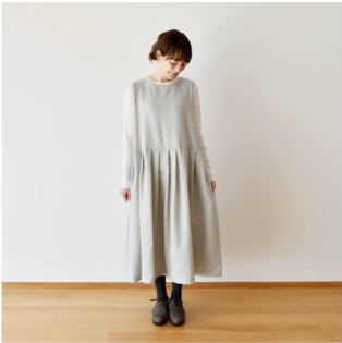
ライトグレー： 『CHECK&STRIPE her closet あのひとの装い』（主婦と生活 社）ジャンパースカート