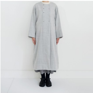
ライトグレー： 『CHECK&STRIPEのおとな服 ソーイング・レメディ―』（文化 出版局）ダブルボタンのコート