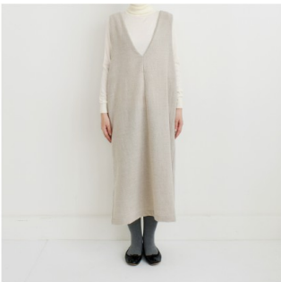
ライトベージュ：『my favorite 私の好きな服』（主婦と生活社） Vネックジャンパースカート