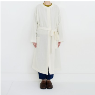
オフホワイト： 『CHECK&STRIPEのおとな服 ソーイング・レメディ―』（文化 出版局）ハーブのラップコート

マフィーユとはフランス語で、「私の娘」という意味です。お子さまにもお使いいただけるような、やわらかい肌ざわりのウールです。 生地になるべくテンションをかけず、通常の仕上げ方法の約3倍の時間をかけてゆっくり1反ずつ洗うことにより、タテ糸とヨコ糸が少しずつ収縮し、ふんわりと膨らみのある特別な風合いになっています。 トップスやワンピースにお使いいただける厚みで、コートにもおすすめです。