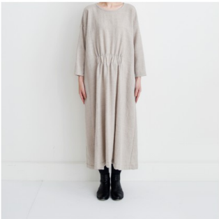
ライトベージュ： 『CHECK&STRIPEのおとな服 ソーイング・レメディ―』（文化 出版局） フロントギャザーのワ ンピース