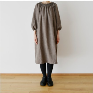
オークベージュ： 『CHECK&STRIPE SEW HAPPY』（世界文化社） ゴムシ ャーリングのワンピース