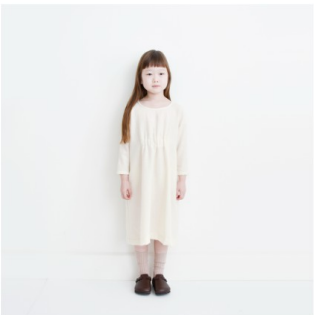
オフホワイト： 『CHECK&STRIPEの子ども服 ソーイング・ナーサリー』（文化 出版局）フロントギャザーのワン ピース