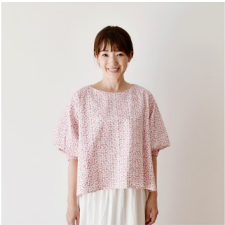
白にワイルドローズ： 『CHECK&STRIPEのおとな服 ソーイング・レメディ―』（文化 出版局） バルーンスリーブのブ ラウス