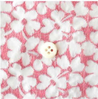
白にワイルドローズ