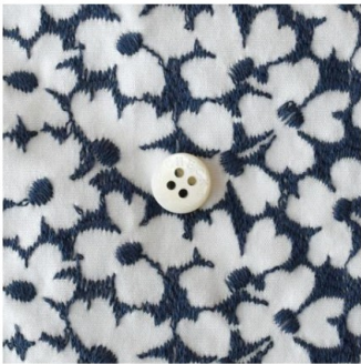
白にアイアンブルー