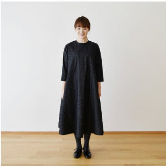
木いちごに黒： 『CHECK&STRIPE Sewing Diary in Paris パリのソーイン グダイアリー』（世界文化社） サイドギャザーのワンピース