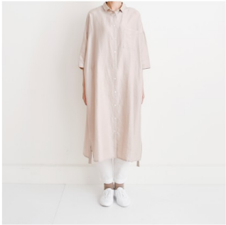
グレイッシュピンク： 『CHECK&STRIPE お気に入りをつくりで』（世界文化社） シャツワンピース