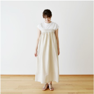
マッシュルूम： 『CHECK&STRIPE COLOUR BOOK 色を楽しむソーイングブック』（文化出版局）後ろゴムのギャザードレス

またブラックは『 DAILY FABRICS 』の『 Sewing Diary in Paris 』で使用した布をご紹介します。そちらのページでご購入いただいた方が早く届きますが、おまけレシピ、ポイントはつきません。