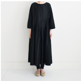
ブラック： 『CHECK&STRIPE my favorite 私の好きな服』（主婦と生活社） タックワンピース