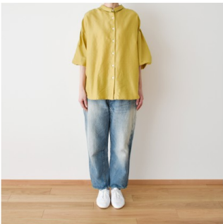
シックマスタード： 『CHECK&STRIPE Sewing Diary in Paris パリのソーイングダイアリー』（世界文化社） ふんわり袖のブラウス 用尺：S 2.7m、M 2.8m、L 2.8m