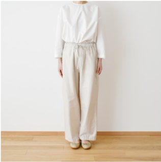
マッシュルूम： 『CHECK&STRIPEのおとな服ソーイング・レメディー』（文化出版局） フローラルパンツ