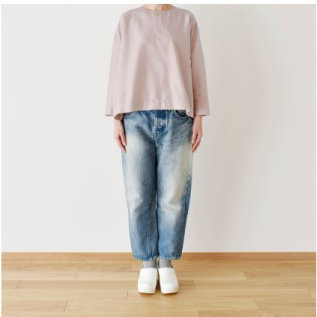
グレイッシュピンク： 『CHECK&STRIPE my favorite 私の好きな服』（主婦と生活社） 後ろボタンのブルオーバー