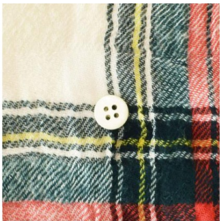
ドレススチュアート