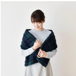
ブラックウォッチ(新色)