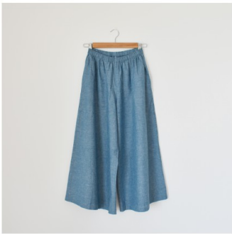
シックブルー： 『CHECK&STRIPE てづくりで ボンボヤージュ』（集英社）ギャ ザーワイドパンツ