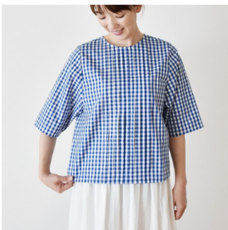
ブルー：『CHECK&STRIPE my favorite 私の好きな服』（主婦 と生活社） タックブラウス