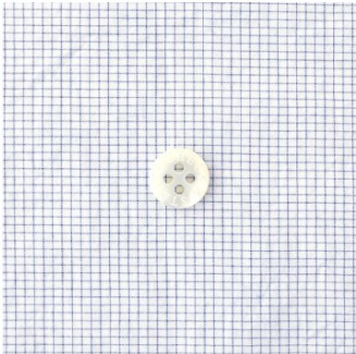
ピンチェック ブルー