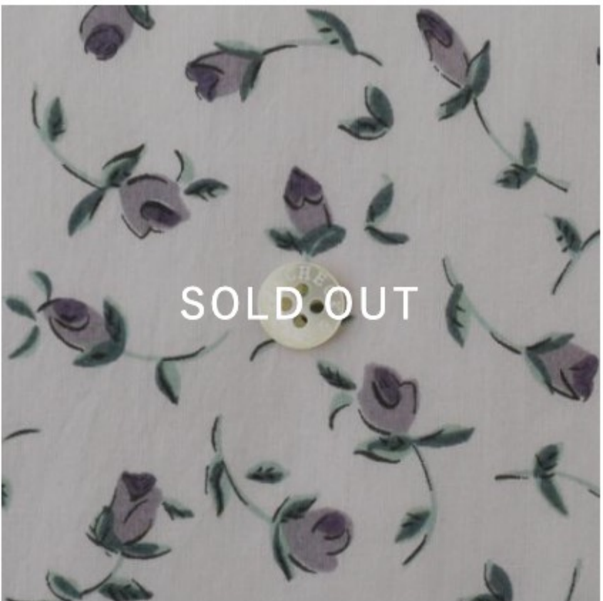
Floating Flora ◎J20C(ライトラベンダー地にラベンダー系)