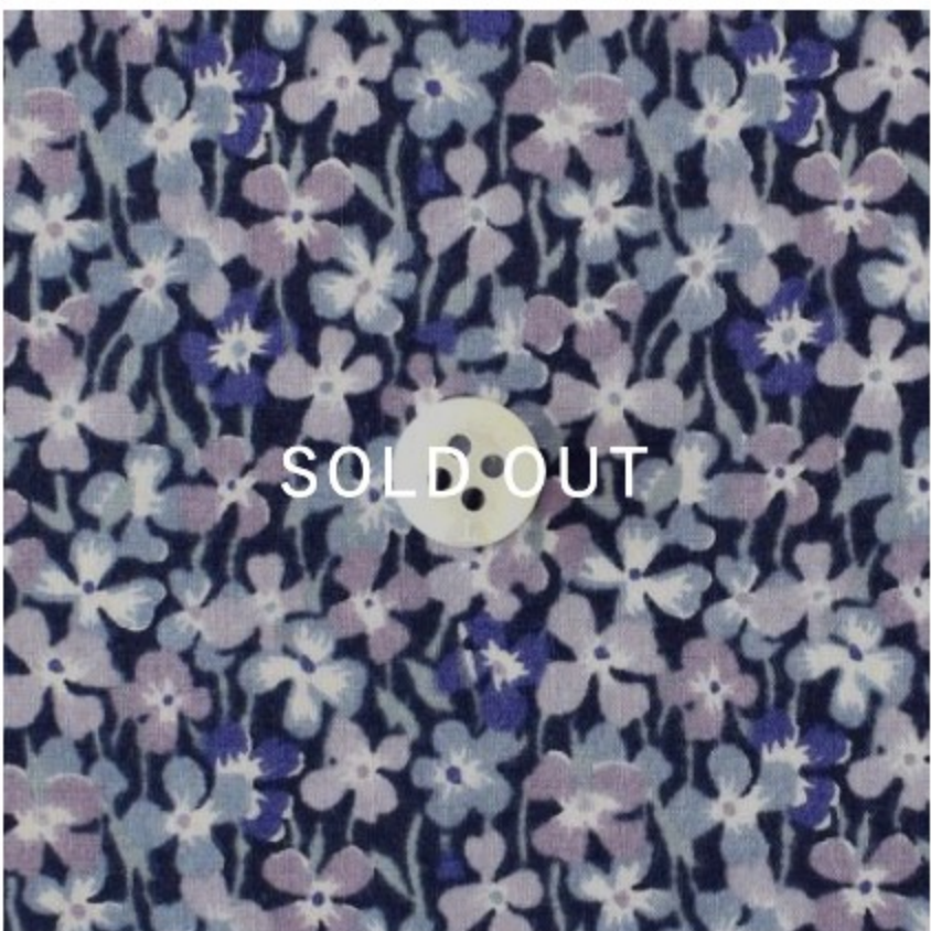
Elmer ◎J24A (ラベンダー系)