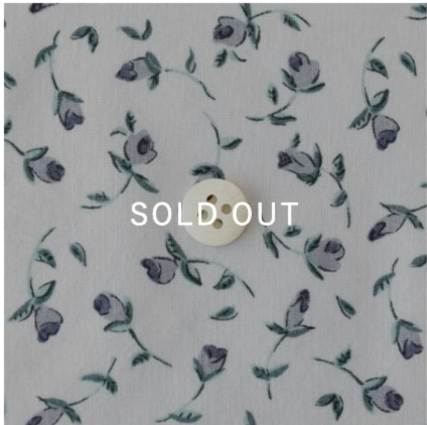
Floating Flora-petite ◎J20C(ライトラベンダー地にラベンダー系)