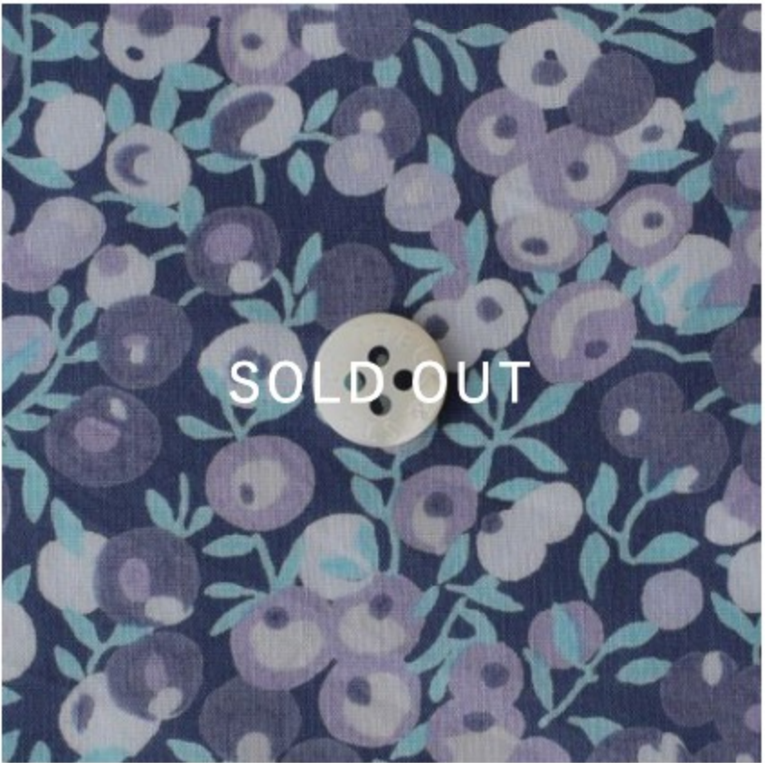
Wiltshire ◎J24F(ネイビーパープル地にラベンダー系)