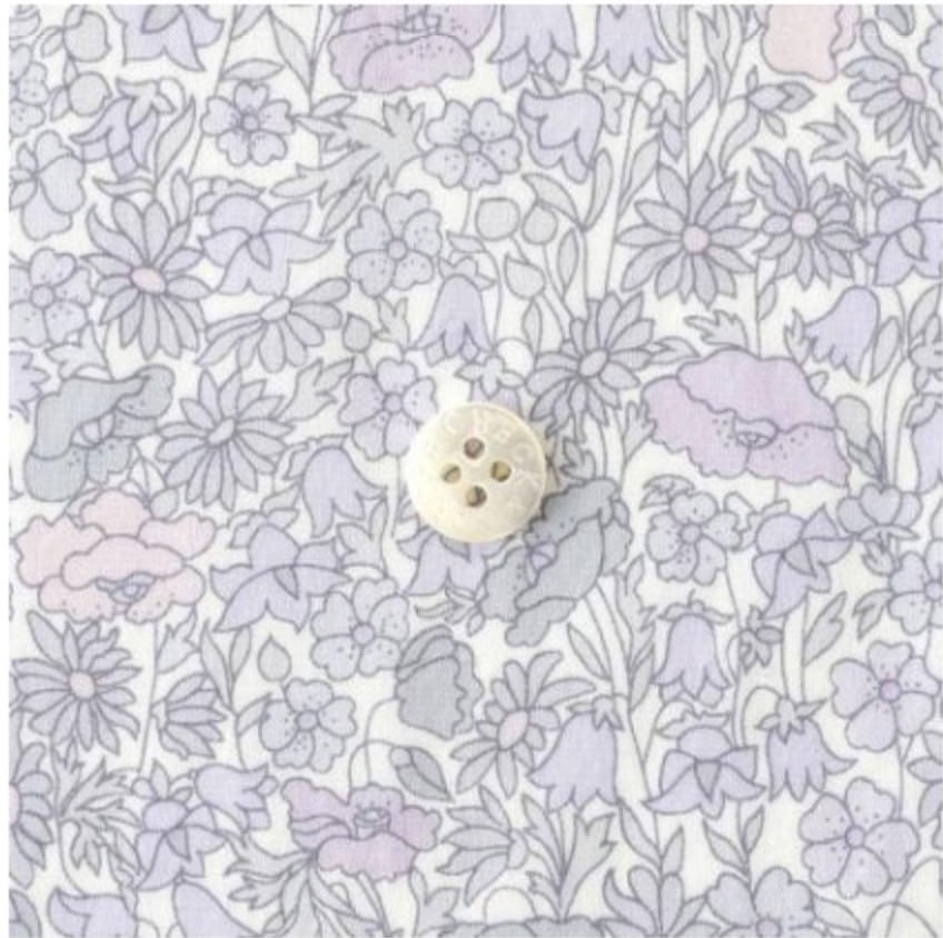
Poppy Forest ◎J22B(ラベンダー系)