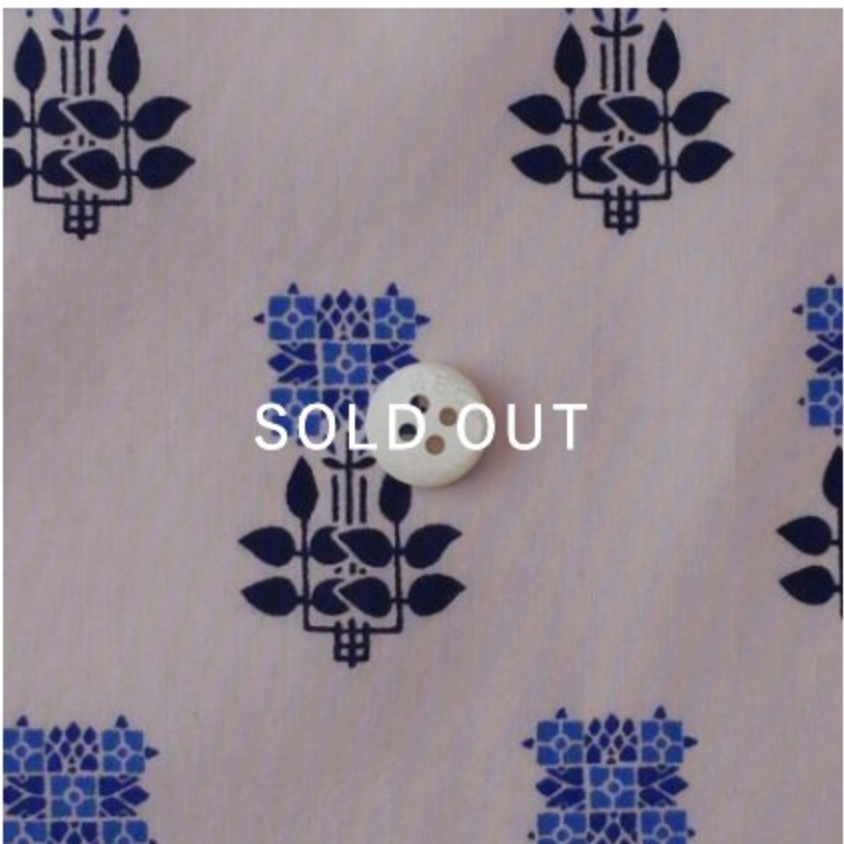
Charles House 23AT(ブルー系)