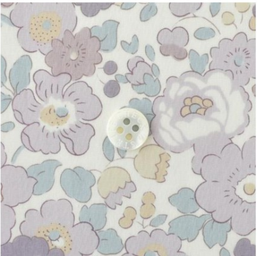
Betsy ◎J21F(オールドラベンダー系)