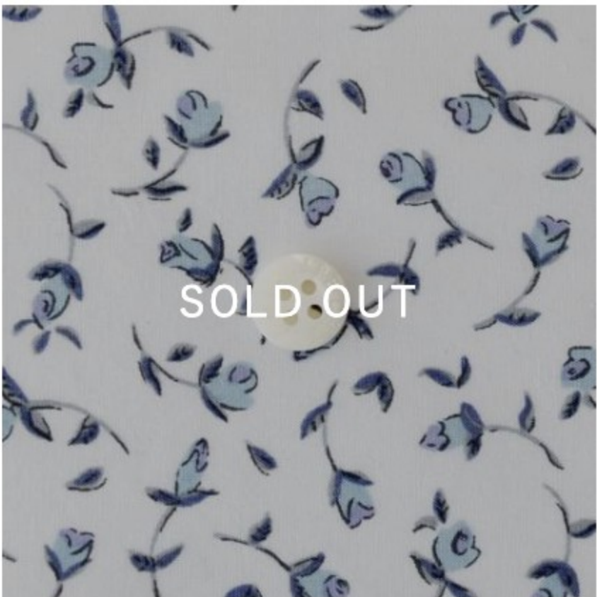
Floating Flora-petite ◎J24A(ブルー・ラベンダー系)