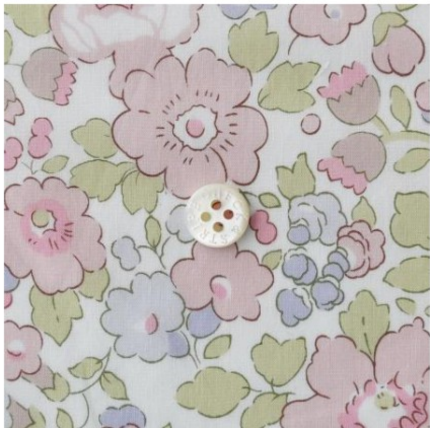
Betsy ◎J19K(ピンク・ラベンダー系)