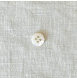
ホワイトグレージュ