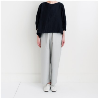
ブラック： 『CHECK&STRIPEのおとな服ソーイング・レメディ―』（文化出版局） バルーンスリーブのブラウス