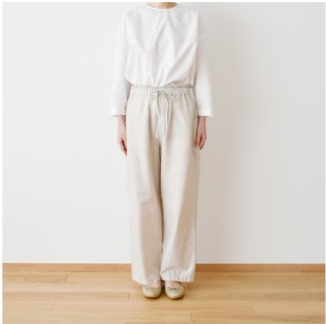
マッシュルーム： 『CHECK&STRIPEのおとな服ソーイング・レメディ―』（文化出版局） フローラルパンツ