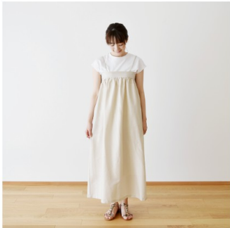
マッシュルーム： 『CHECK&STRIPE COLOUR BOOK 色を楽しむソーイングブック』（文化出版局） 後ろゴムのギャザードレス

またブラックは『 DAILY FABRICS 』の『 Sewing Diary in Paris 』で使った布をご紹介します。そちらのページでご購入いただいた方が早く届きますが、おまけレシピ、ポイントはつきません。