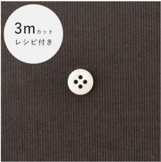
チャコールグレー