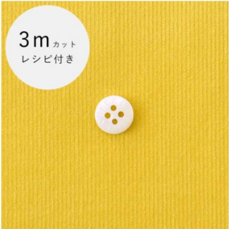
ターメリックイエロー