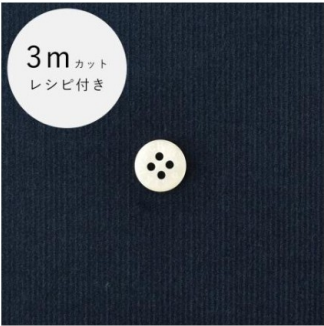
インディゴネイビー