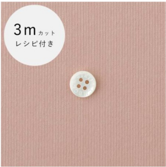
スモーキーピンク