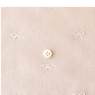
グレイッシュピンクにオフホワイト