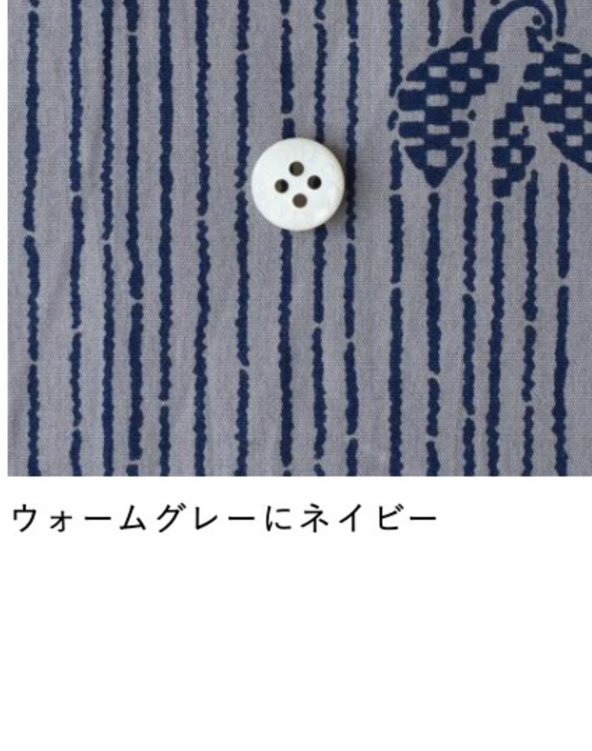
ウォームグレーにネイビー