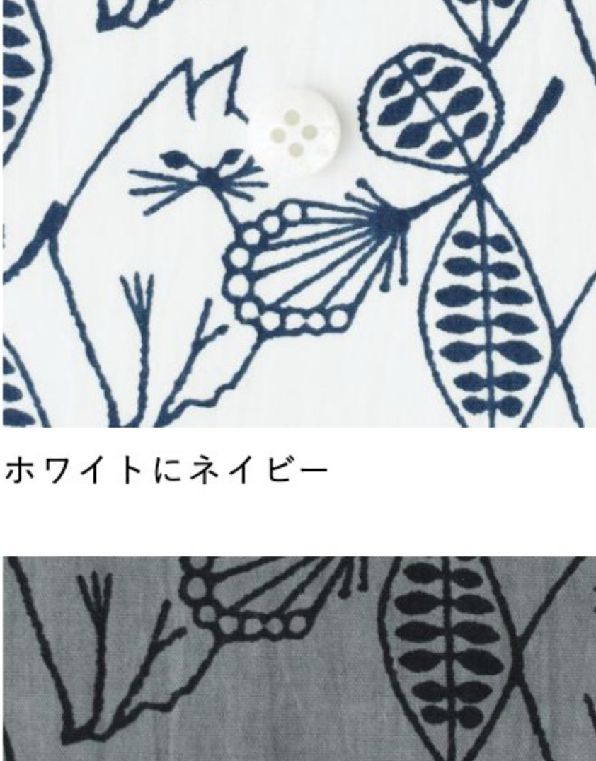
ホワイトにネイビー