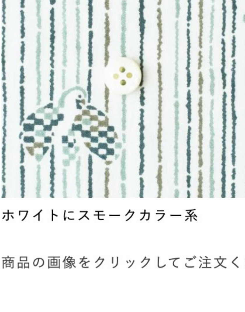
ホワイトにスモークカラー系