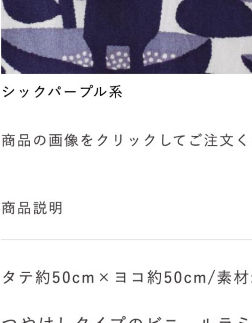
シックパープル系