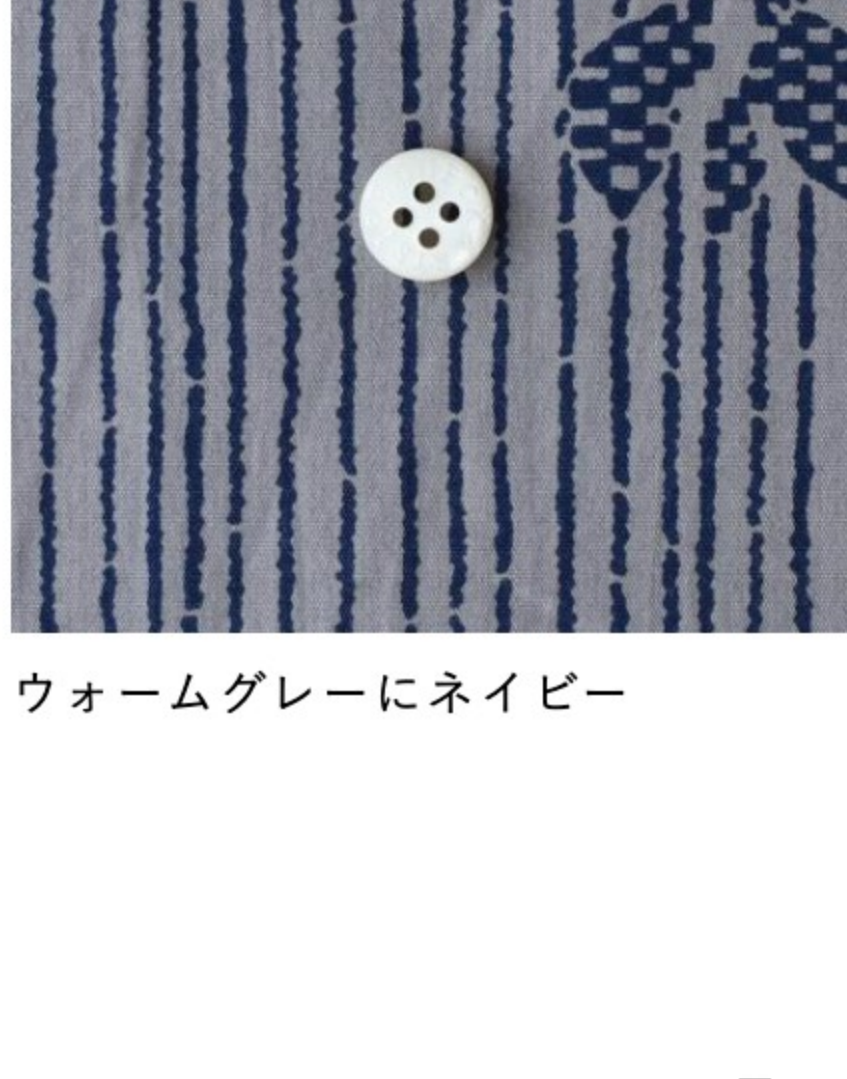
ウォームグレーにネイビー