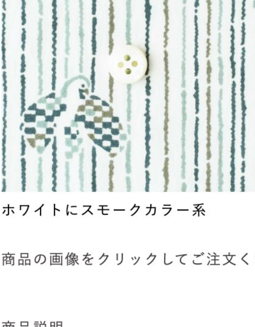
ホワイトにスモークカラー系