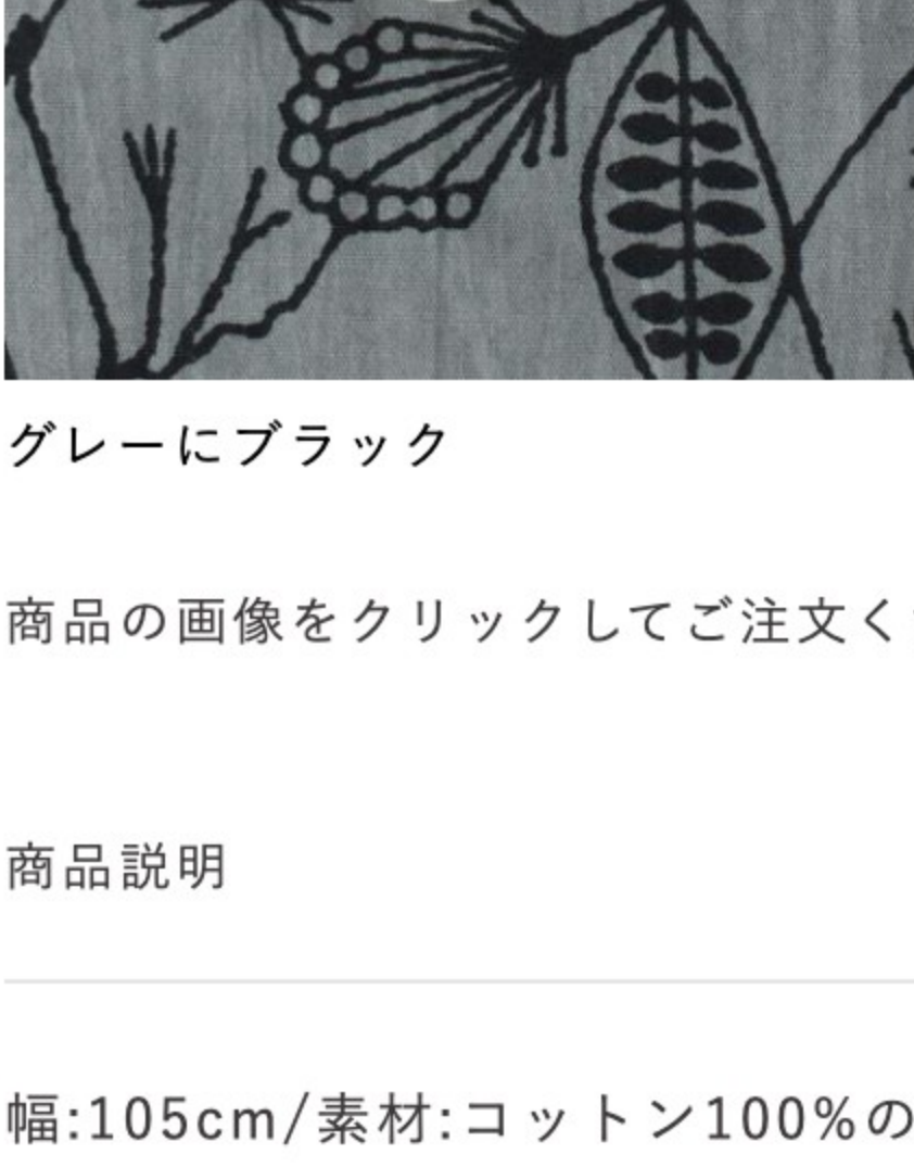
グレーにブラック