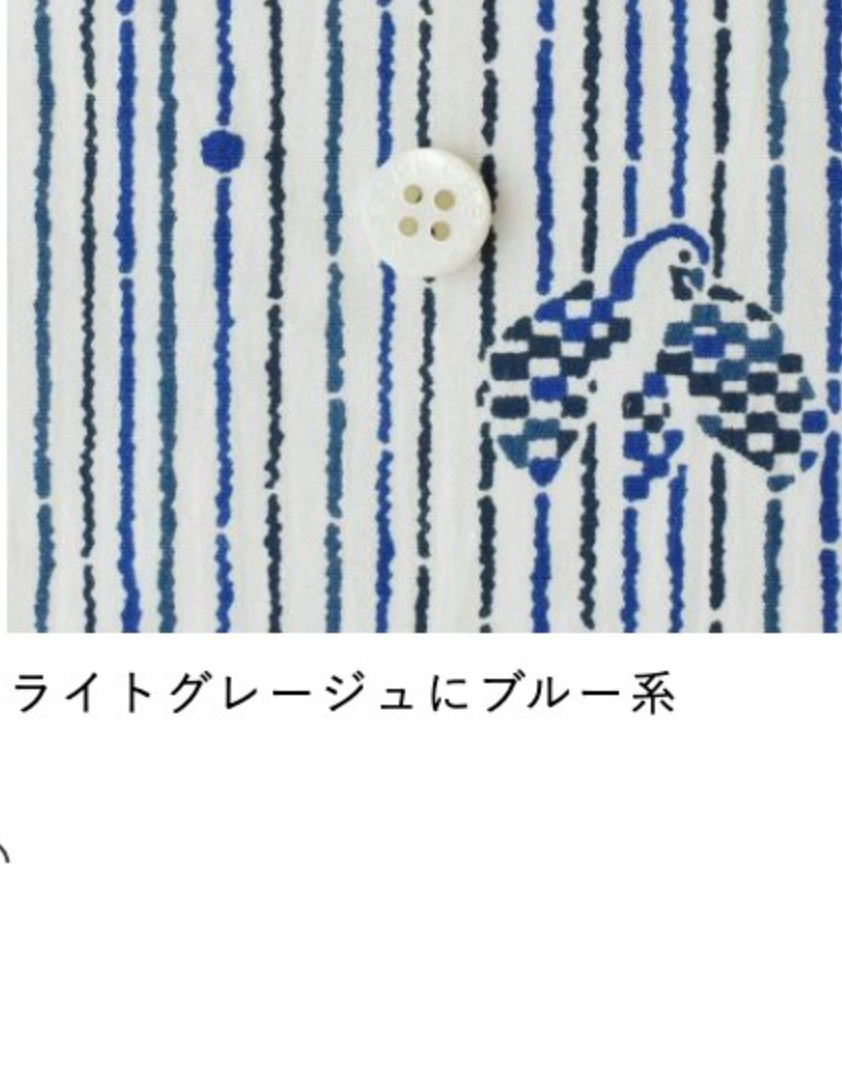
ライトグレージュにブルー系