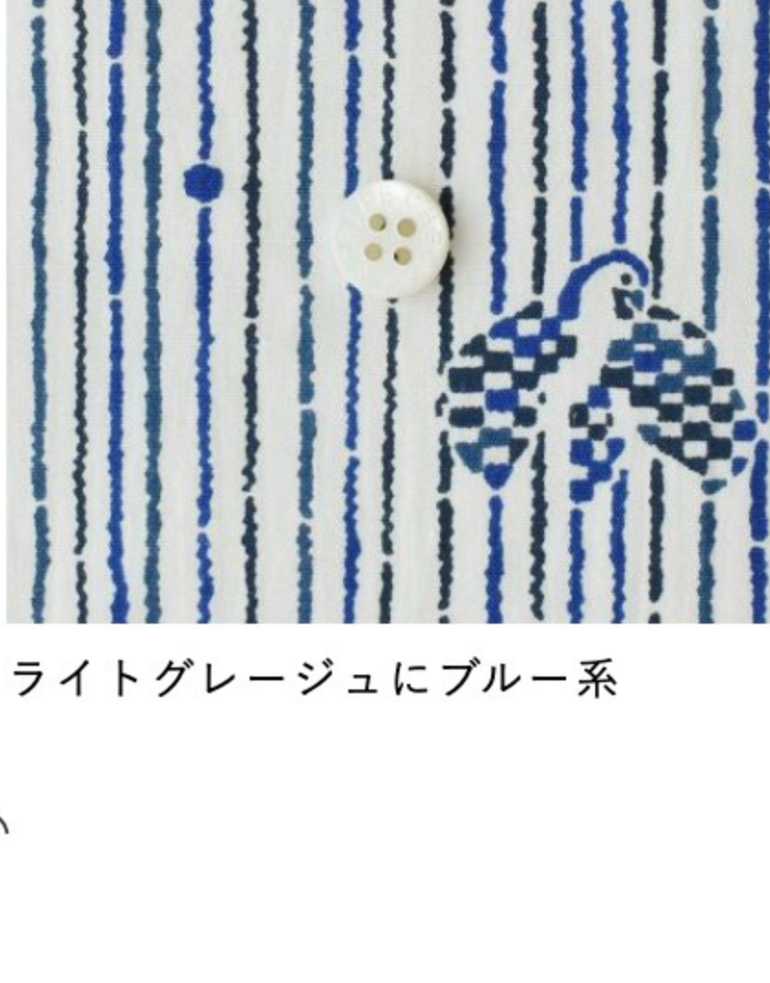
ライトグレージュにブルー系