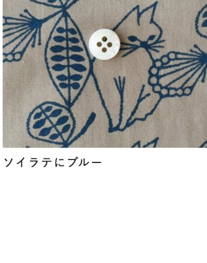
ソイラテにブルー