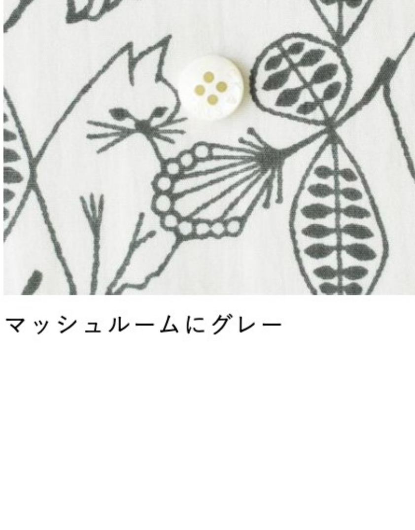
マッシュルームにグレー