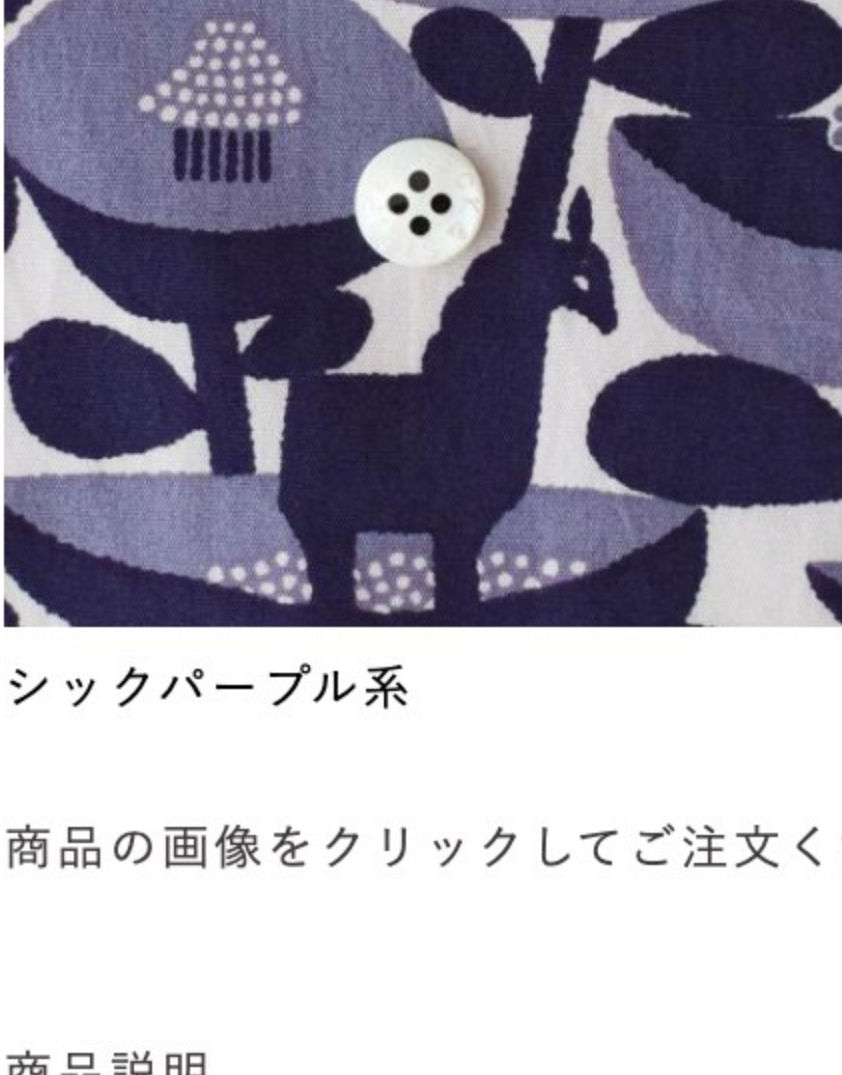
シックパープル系