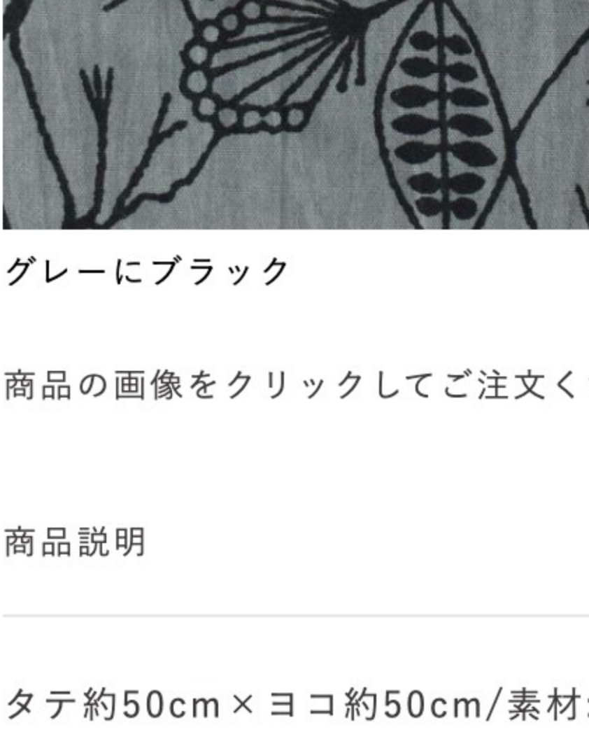
グレーにブラック