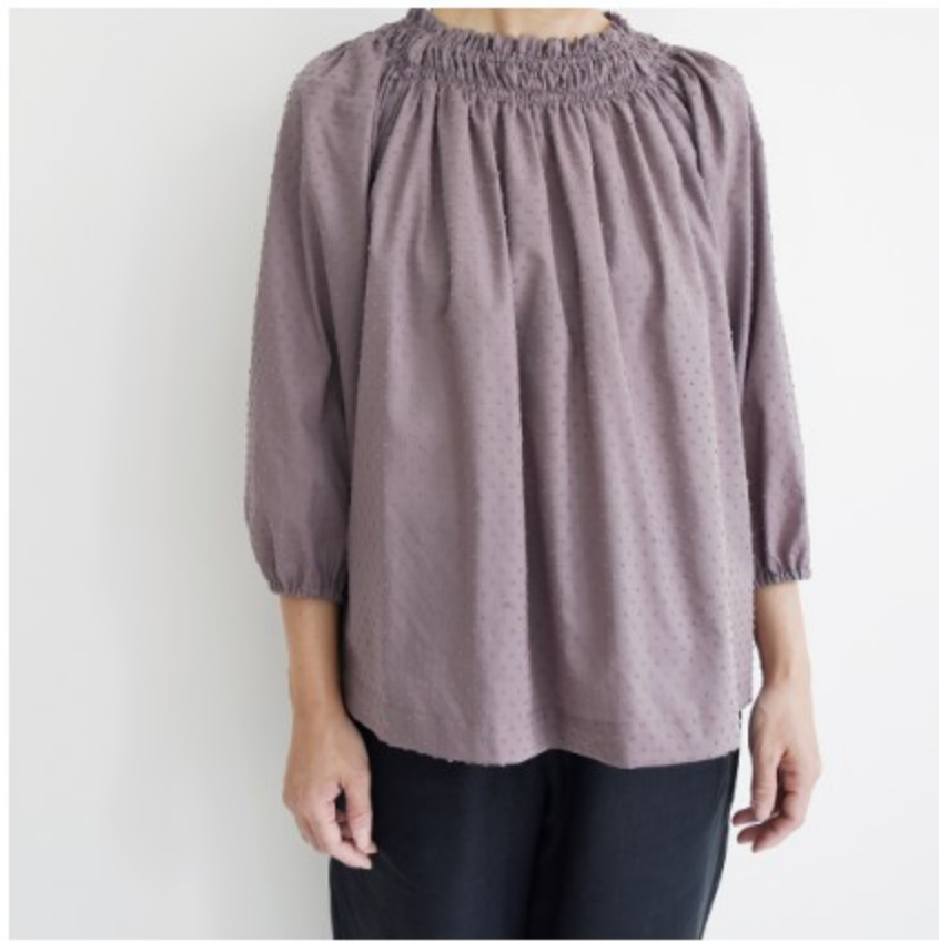
あずきミルク： 『CHECK&STRIPE SEW HAPPY』（世界文化社）ゴムシ ャーリングのブラウス