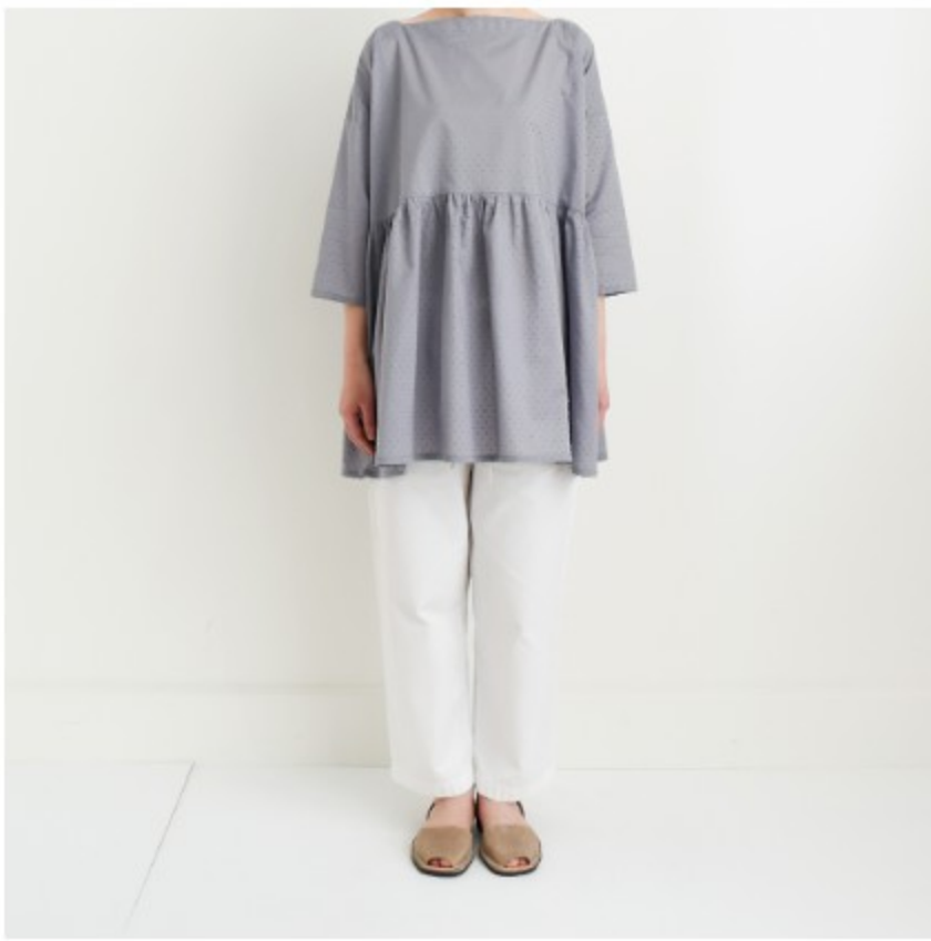
ラベンデューラ： 『CHECK&STRIPEのおとな服 ソーイング・レメディー』（文化 出版局）スクエアネックのギャザ ーブラウス