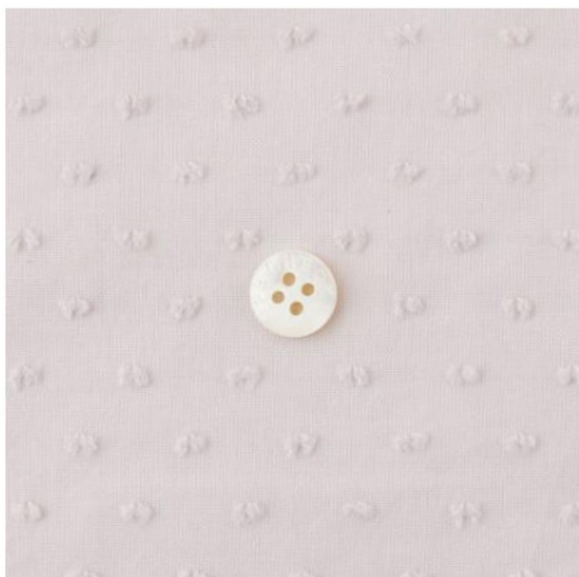
ピンクラベンダー