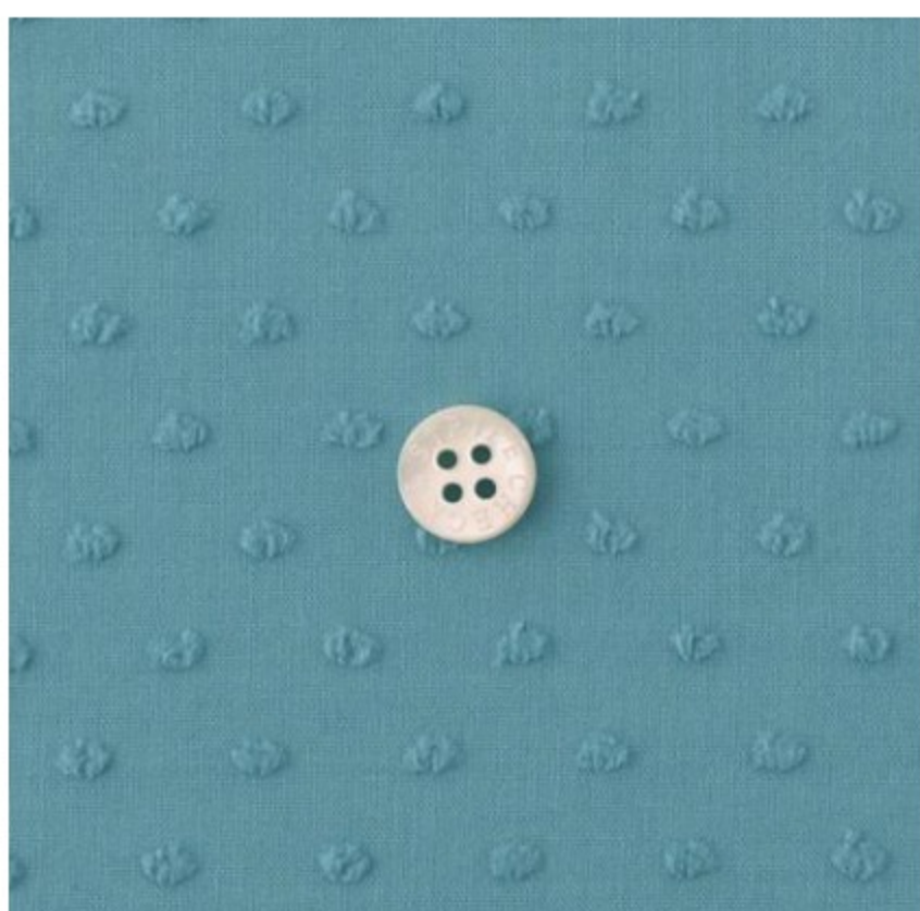
フォゲットミーノット