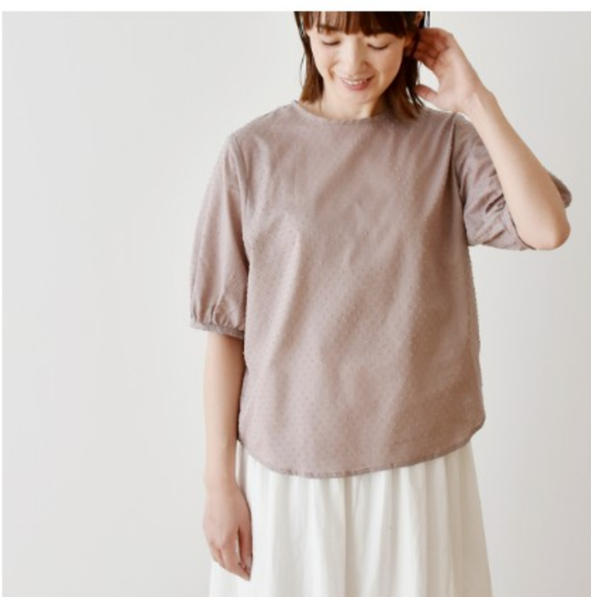
あずきクリーム： 『CHECK&STRIPE COLOUR BOOK 色を楽しむソーイングブ ック』（文化出版局）後ろリボン のパフブラウス