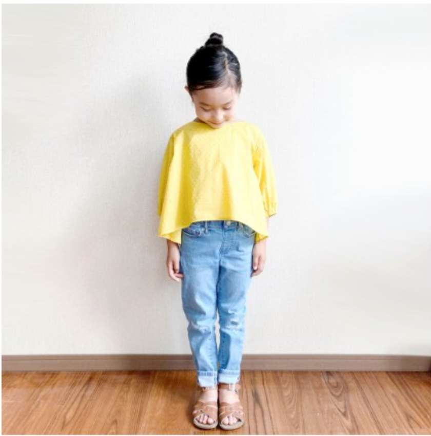
マリーゴールド： 『CHECK&STRIPEの子ども服 ソーイング・ナーサリー』（文化 出版局）バルーンスリーブのブ ラウス