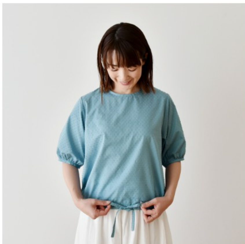
フォーゲットミーノット： 『CHECK&STRIPE COLOUR BOOK 色を楽しむソーイングブ ック』（文化出版局）フロントリ ボンのパフブラウス

カット作業の工程上、ドットの形状が均一ではなく、画像より横長になる場合があります。