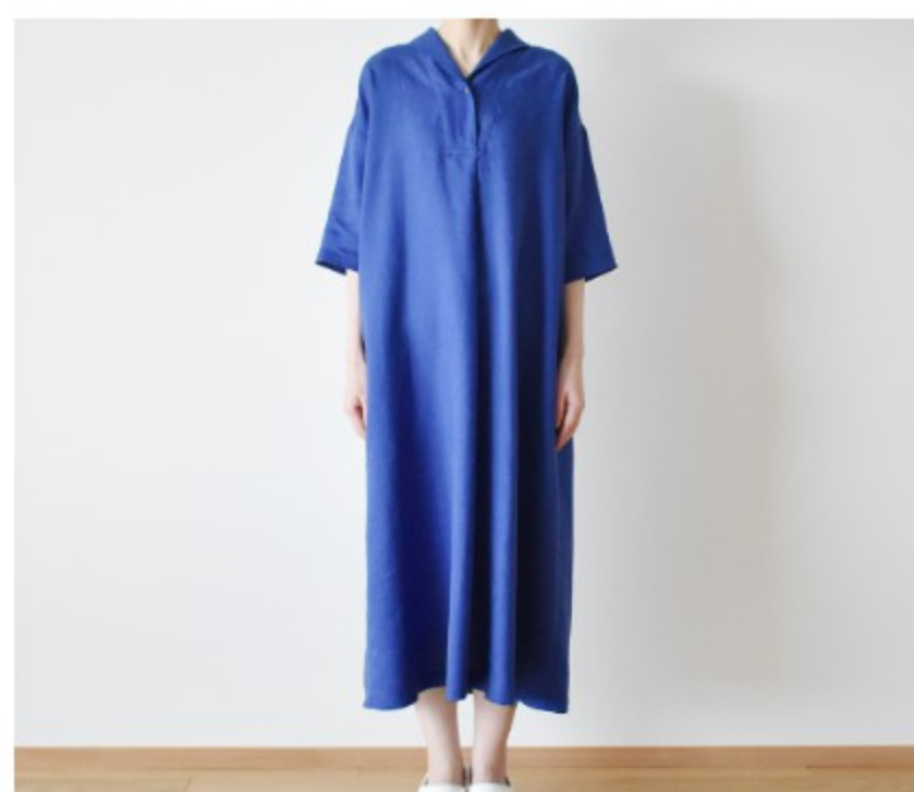
サファイア:『CHECK&STRIPE Sewing Diary in Paris パリのソーイングダイアリー』(世界文化社)ウィークエンドのワンピース