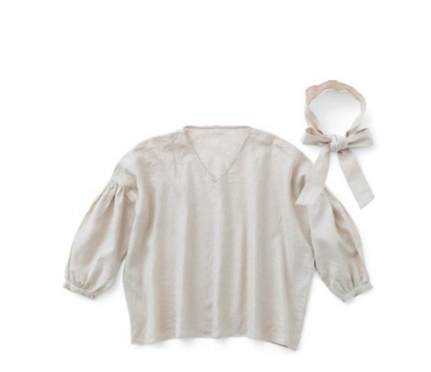
マッシュルーム:CHECK&STRIPEのおとな服ソーイング・レメディ』(文化出版局)Vネックプルオーバー