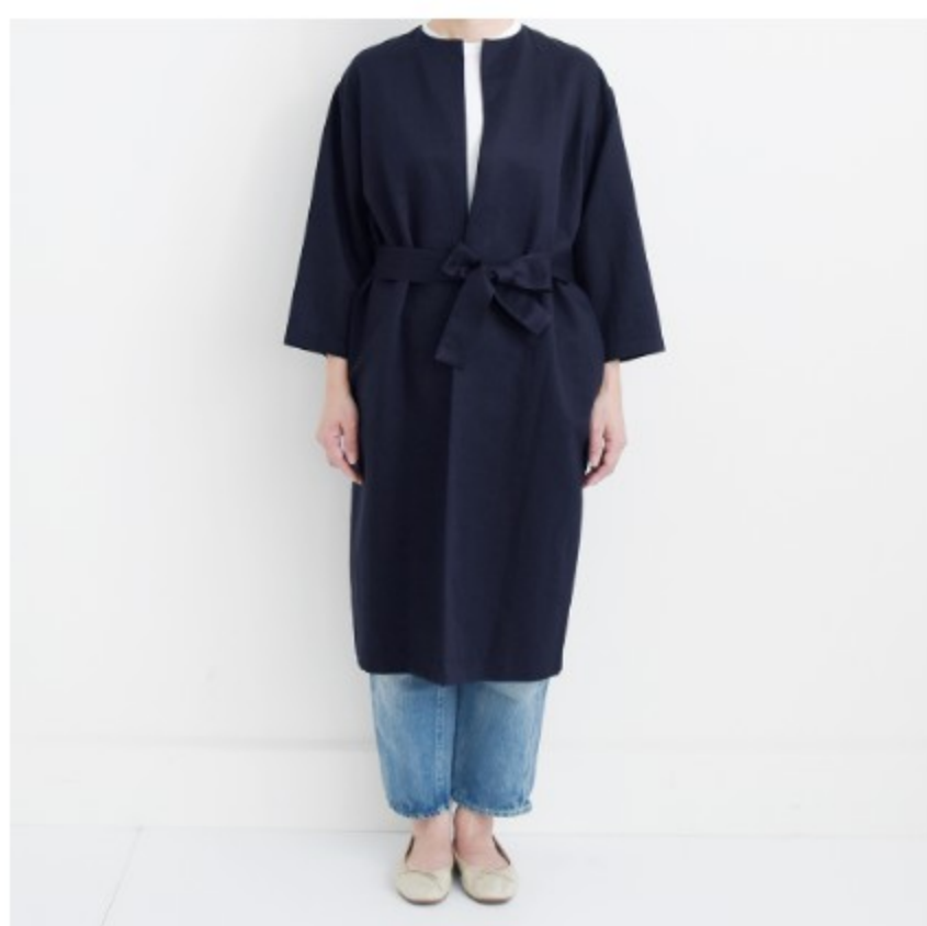
ダークネイビー: 『CHECK&STRIPE 北欧てづくり散歩』(集英社) よそいきのシンプルコート