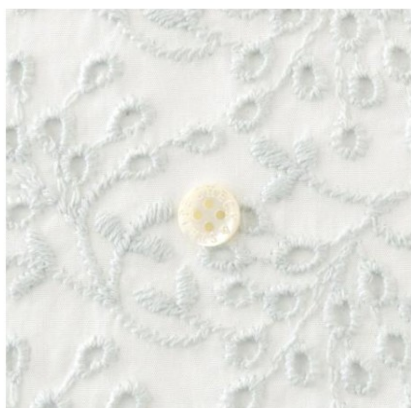
ホワイトにアクア