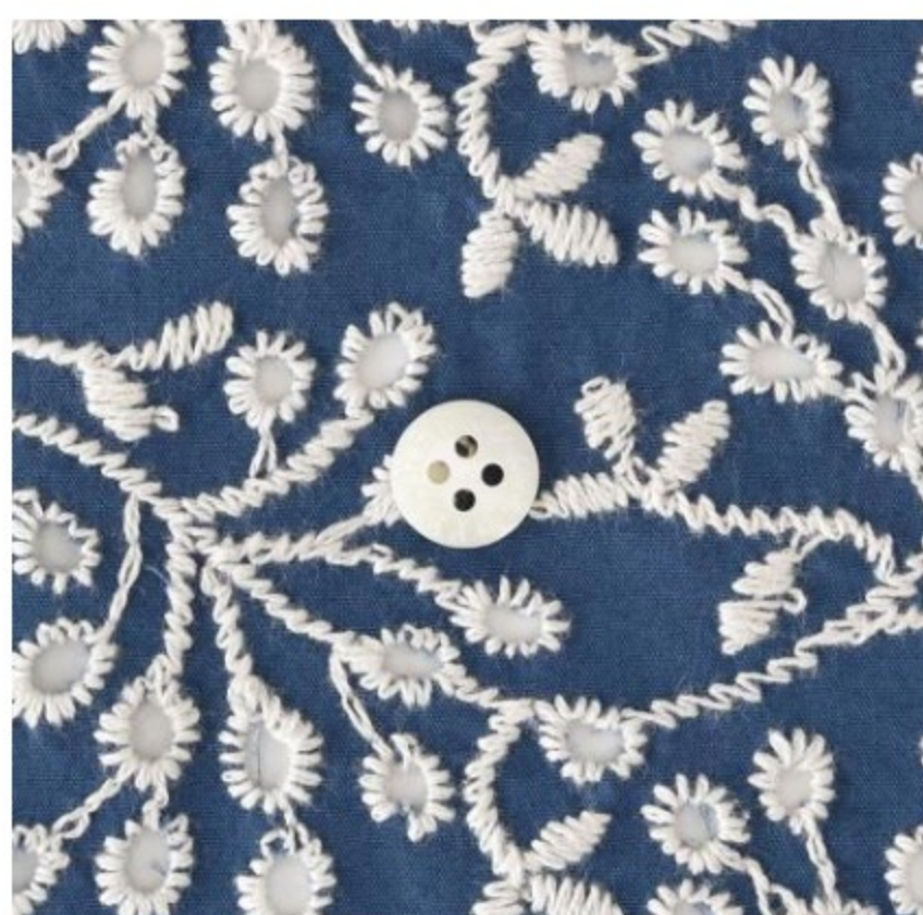
スモークブルーにアイボリー