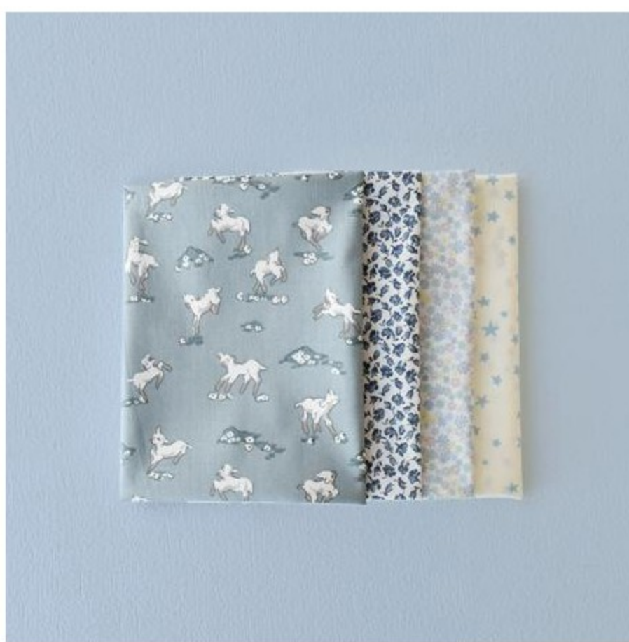
ブルー・ネイビー系