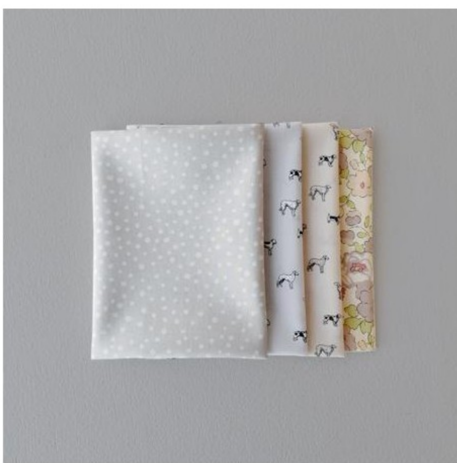
グレー・ブラウン系