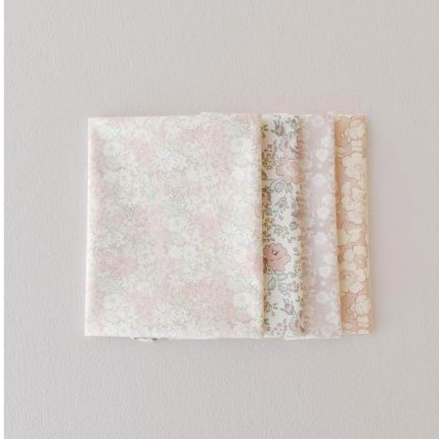
フレンチカラー系