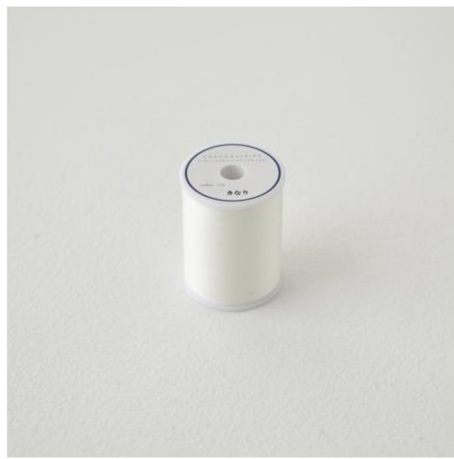
副資材（ミシン糸など）