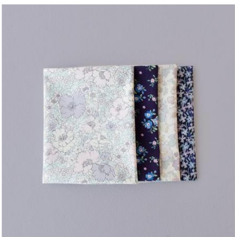
ラベンダー・パープル系