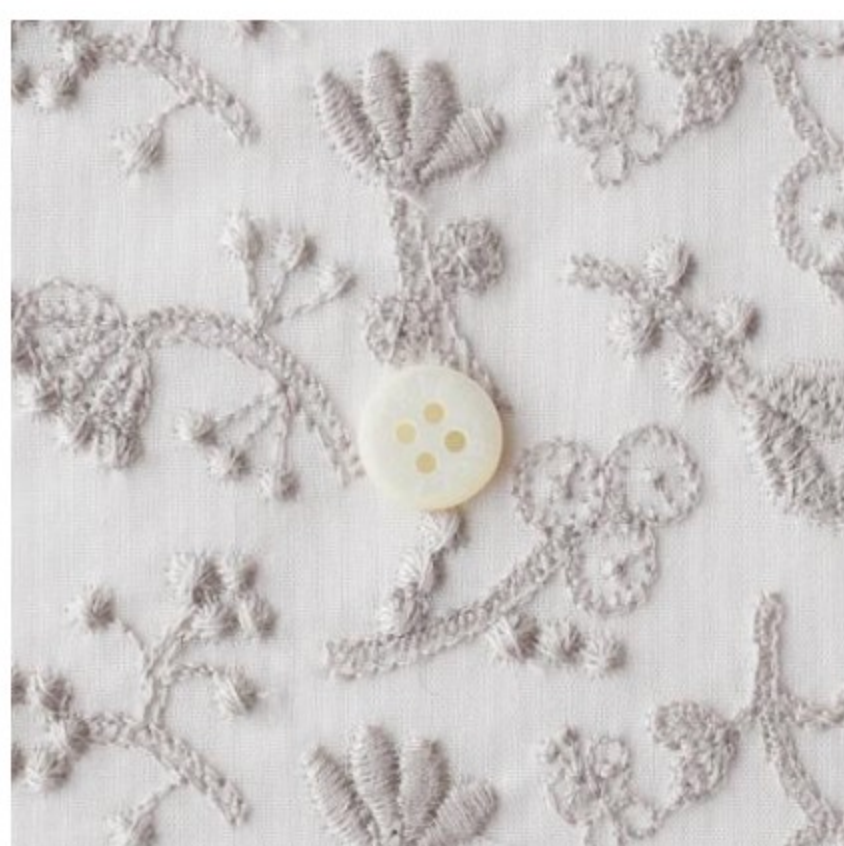
stripe powder pink