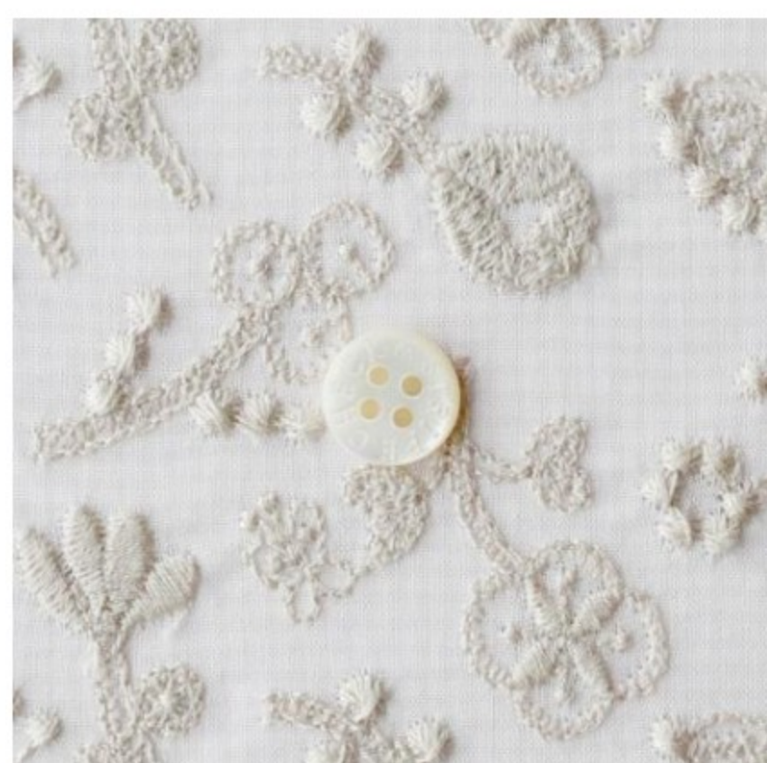
check powder pink