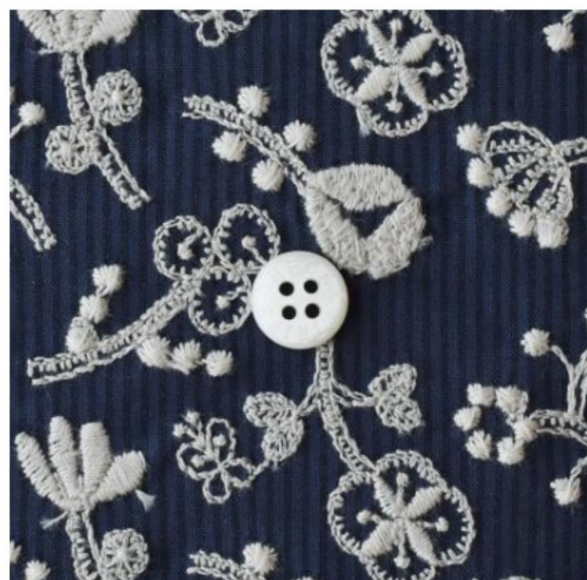
stripe navy black