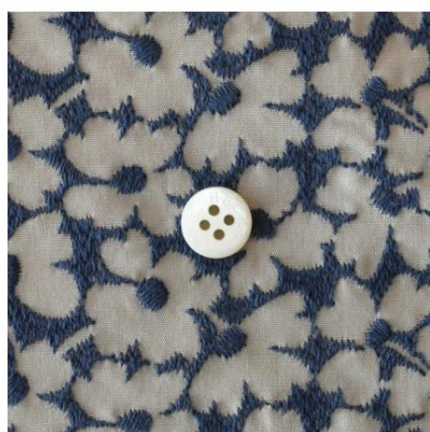
ソイラテにアイアンブルー